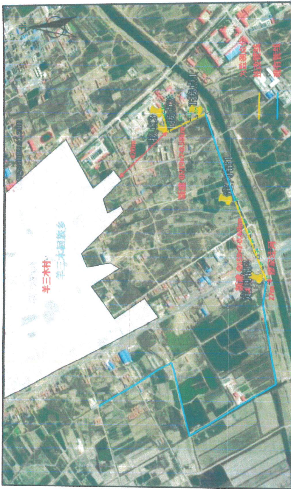
附：敏感点噪声检测点位示意图

注：△为敏感点噪声检测点位； 2019年12月7日，天气：晴；风速：0.9m/s； 2019年12月8日，天气：晴；风速：1.3m/s。