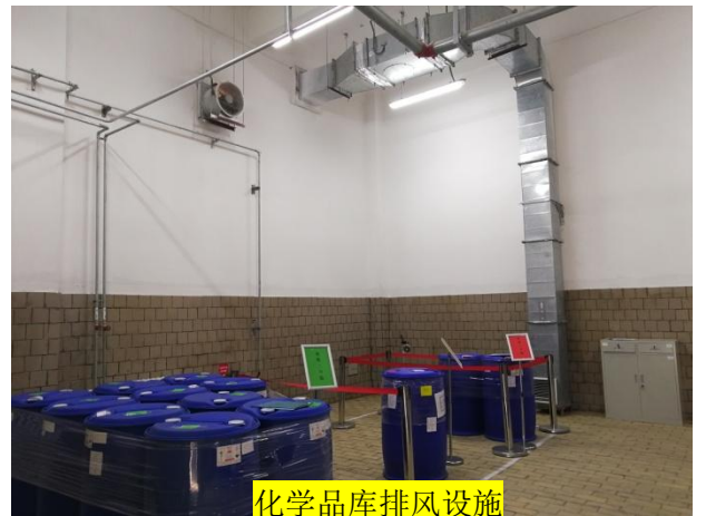
化学品库排风设施