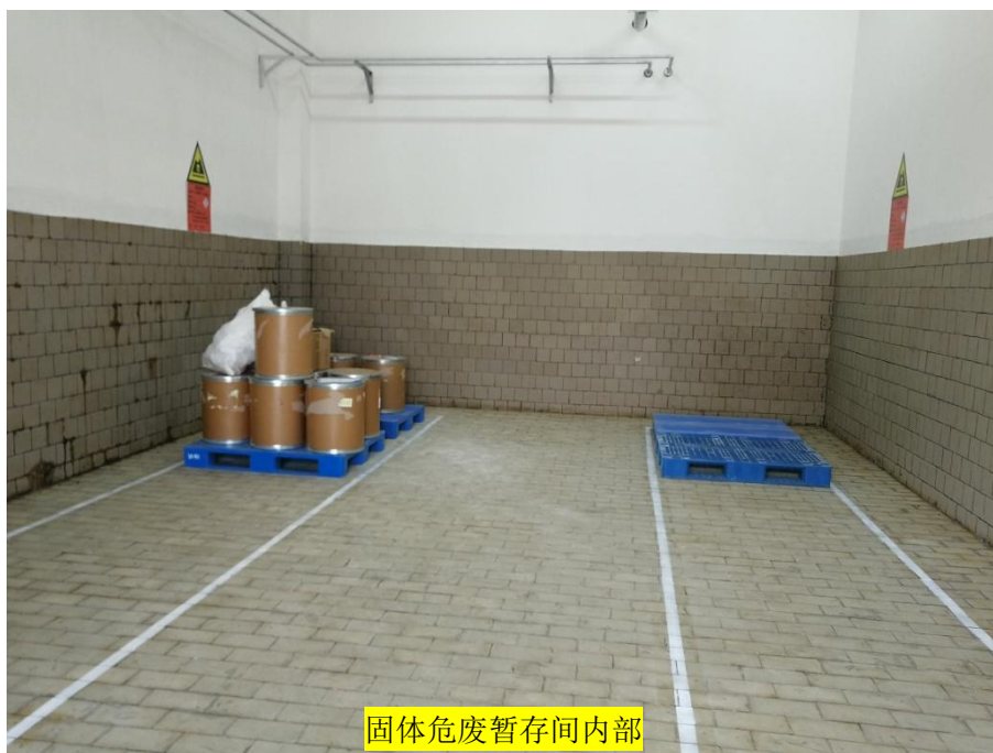
图 4-6 危险废物储存设施