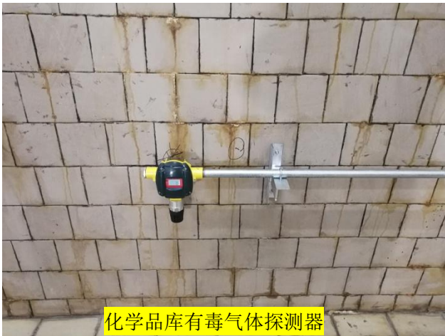
化学品库有毒气体探测器