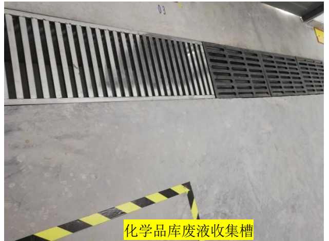
化学品库废液收集槽