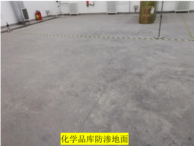
化学品库防渗地面