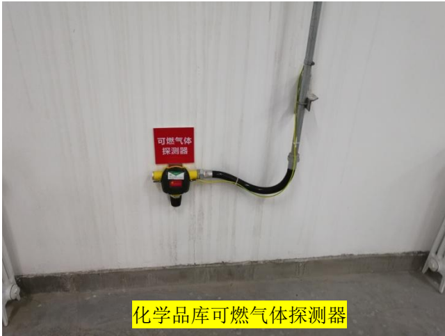
化学品库可燃气体探测器